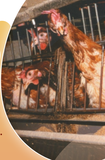
Photos PMAF / © flucas - Fotolia.com - Ne pas jeter sur la voie publique

En France, 80% des poules sont élevées en cages grillagées. La densité d'élevage est de 13 à 18 poules par m 2 .